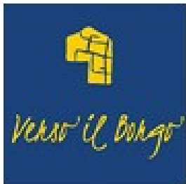
Iniziativa a Padernello