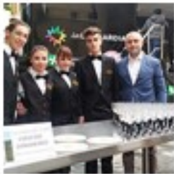
Giro d'Italia Brescia