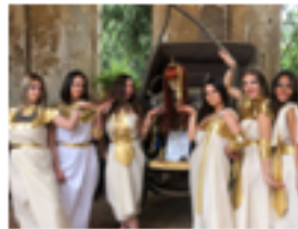
Sfilata di Moda Padernello