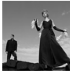
Sfilata di Moda Brescia