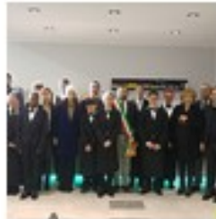
Visita delegazione Cipro e Slovenia Lumezzane