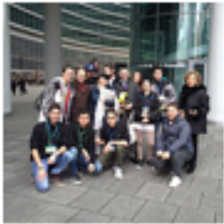
Stati Generali della Formazione Milano