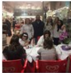
Iniziativa Arcadia Lumezzane