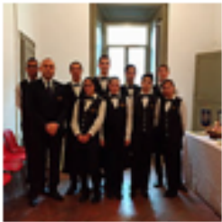
Convegno A.D.I.D. Brescia