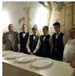
Iniziativa Strada del Vino Colli dei Longobardi Montichiari