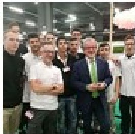
Fiera Expotraining Milano